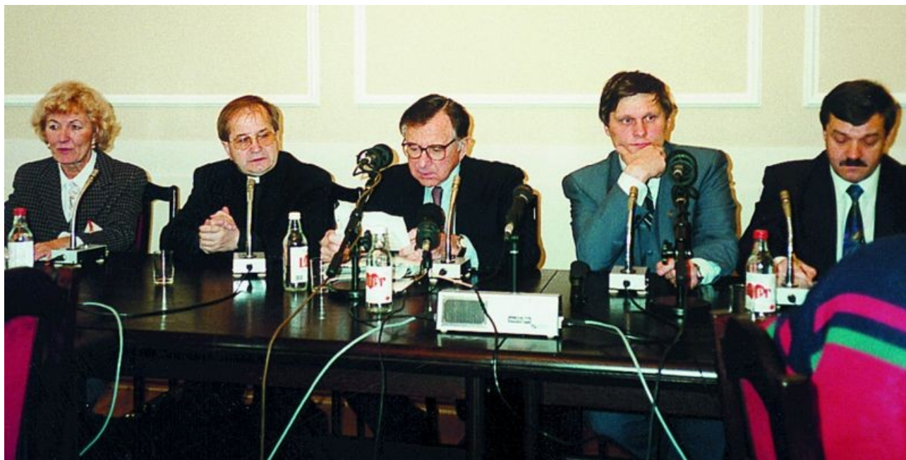
Podczas konferencji prasowej w Galerii Porczyńskich w Warszawie

Doktor gościł w Polsce w październiku 1996 r. na zaproszenie Radia Maryja .