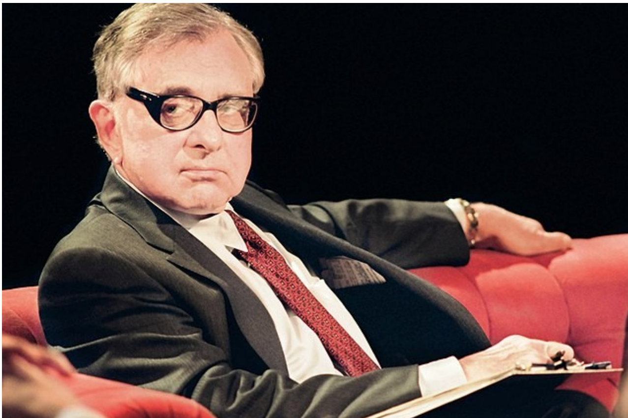
dr Bernard Nathanson w programie dyskusyjnym brytyjskiej telewizji „After Dark (Po zmroku)” w 1997 r.

Dr Bernard Nathanson to amerykański ginekolog, aborcjonista odpowiedzialny za śmierć kilkudziesięciu tysięcy poczętych dzieci, w tym własnych. W jego życiu nastąpiła przemiana, kiedy uświadomił sobie, że zabicie dziecka w łonie matki jest takim samym zabójstwem, jak zabicie żywego. Z aborcjonisty stał się antyaborcjonistą, propagatorem cywilizacji życia. W grudniu 1996 roku został katolikiem.